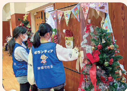
地域のボランティアの皆様