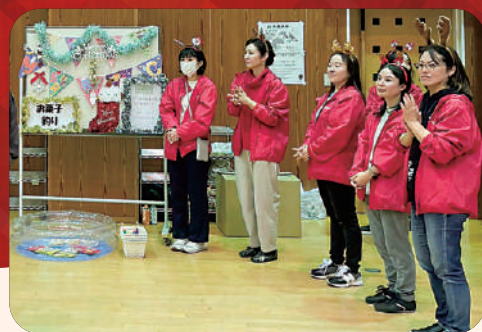
(株)三菱UFJ銀行平針支店ボランティアの皆様